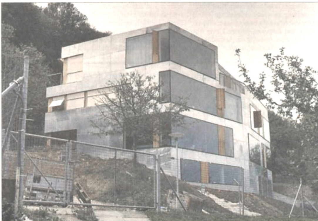
Eine Hülle aus vorgehängten Blechen: Das Vierfamilienhaus am Waldrand